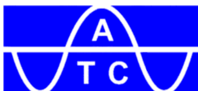
Ranking Piramidal Tênis ATC